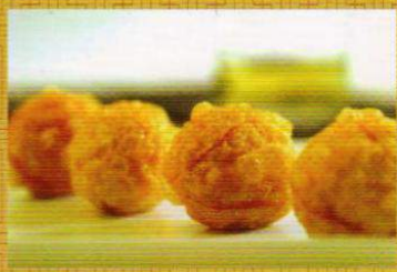
10 花枝丸 Bola de dragón

Pasta de pescado con sepia y gambas. Paste of fish with cuttlefish and prawn.