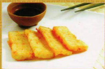
12 港式蘿蔔糕 Pastel de rábano

Empanadilla de pollo al curry. Samosa of chicken to curry.