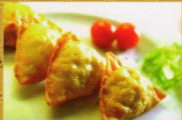
11 咖喱餃 Samosa

Pasta de pescado con sepia y gambas. Paste of fish with cuttlefish and prawn.